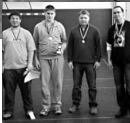
Vánoční turnaj města Třeboně