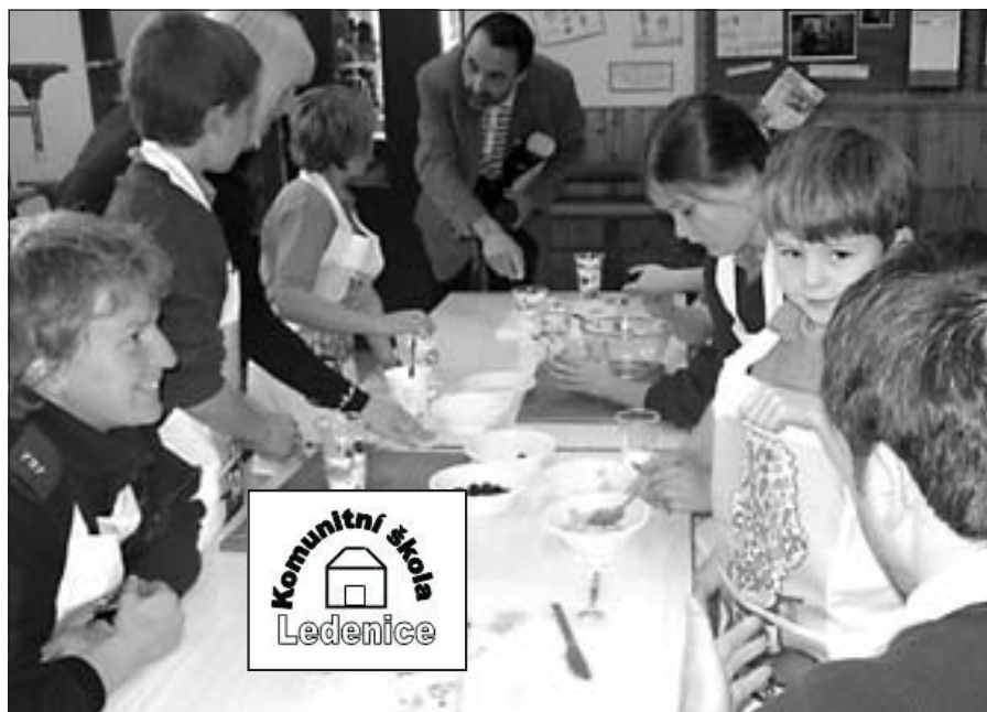
Kurzy vaření ve velšské komunitní škole