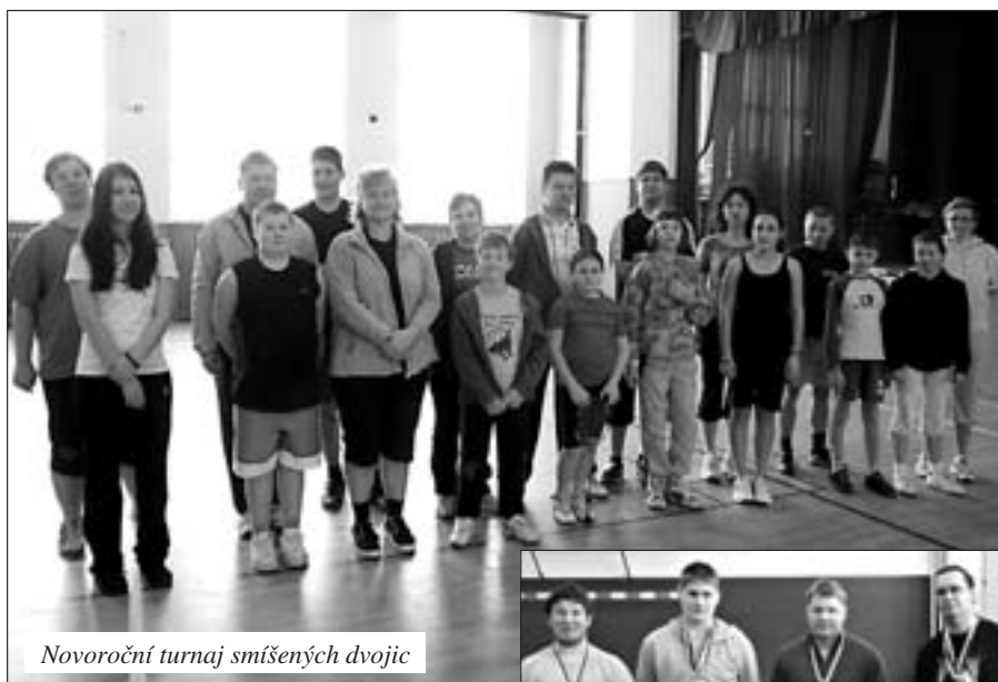
Novoroční turnaj smíšených dvojic

Novoroční královskou jízdou přivítali příznivci letité traktorové techniky nový rok 2011 ve Zborově. Opět po roce, opět na Nový rok, letos poprvé však na sněhu - po upravených polních cestách i zasněžené louce. Těžký terén byl oříškem zejména pro samohyby, ale i ty se ním dokázaly vypořádat. Sníh a teploty pod nulou ovlivnily i počet účastníků, hlavně účast jednotlivých strojů. Přesto můžeme považovat letošní ročník za další úspěšný. Ti, kteří jeli vloni a nedorazili, byli plně nahrazeni novými účastníky, zejména aktery z Ledenic. Velmi se osvědčili regulovčící v dobových uniformách československé armády, kteří řídili provoz na křižovatkách. O tom, že naše novoroční akce má ohlas široko daleko, svědčí i velké množství návštěvníků, kteří přijeli obdivovat staré traktory, ale i šikovné ruce českého človíčka při výrobě samohybů. A nyní krátká rekapitulace: počet zúčastněných strojů 25, z toho 17 traktorů, 7 samohybů a jedna tovární rikša. I letos byly mezi námi ženy - ne jen jako závoznice, ale dokonce jako dvě řidičky.