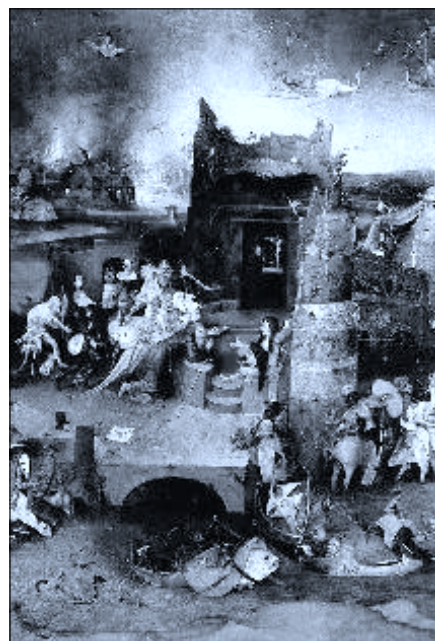
Výřez z obrazu Hieronyma Bosche Pokušení sv. Antonína

Tenkrát v noci démoni ztropili takový hluk, až se zdálo, že se celé to místo otřásl. A jako by se sesuly všechny čtyři stěny Antonínova přibytku, vtrhli dovnitř přeměnění na přízraky zvířat a hadů. Antonín ležel bez pohnutí, a ačkoli byl vysílen tělesným utrpením, přece však měl střízlivého ducha, a jako by se posmíval, pravil: „Pokud můžete a máte-li nade mnou moc, potom neprodlévejte a napadněte mne.“