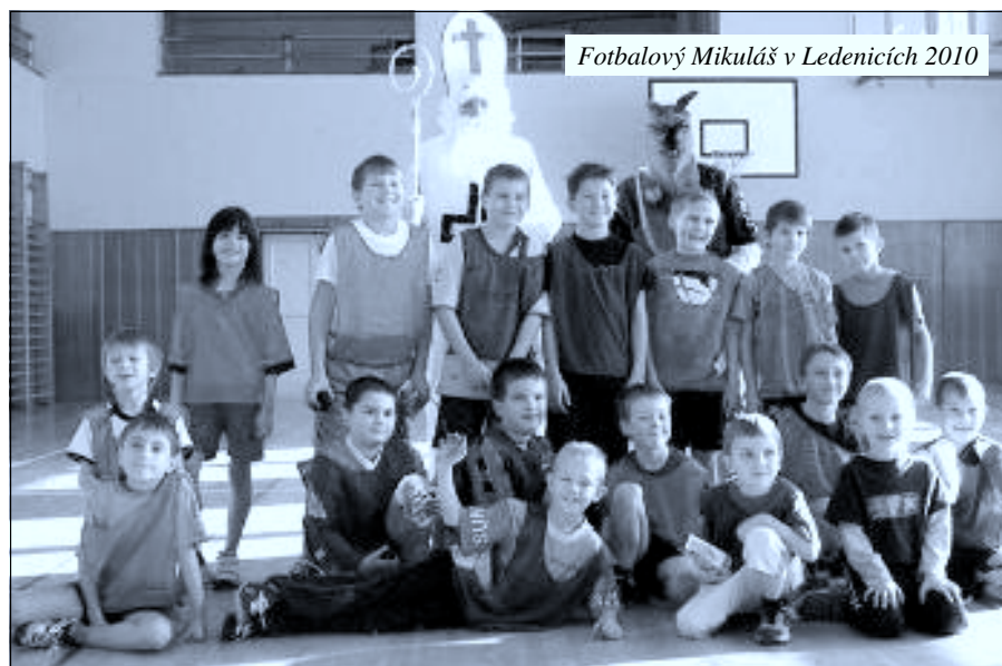
Fotbalový Mikuláš v Lednicích 2010