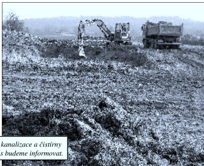
Na přelomu roku 2010 / 2011 bylo ve Zborově započato s výstavbou kanalizace a čistírny odpadních vod. Stavba potrvá po celý rok 2011 a o jejím průběhu vás budeme informovat.