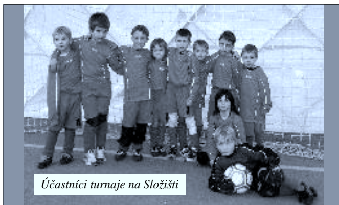
Účastníci turnaje na Složišti

Kromě odehraných zápasů si hráči vyzkoušeli v rámci individuálních soutěží i takové speciality jako je měření rychlosti střelby, přesnost střelby, opičí dráhu nebo slalom s míčem. Nejtvrdší střelou se