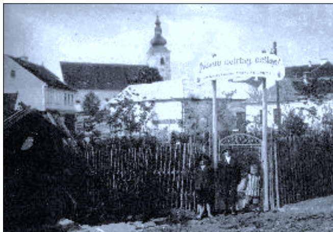
Park na ledenickém náměstí zřízený zásluhou Okrašlovacího spolku. Snímek pochází z roku 1924 a vidíme na něm mj. dřevěné oplocení a vrátka, nad kterými je umístěn nápis: Nelam, netrhej, nešlap!

Díky spolku byly osázeny stromy i stráně nad rybníky Lazna a Horní Hradský nebo aleje u silnic na Budějovice a Trocnov. Dále se členové věnovali úpravám cest a chodníků, zřídili krásné zahrádky před radnicí a školou či tarasy podél cesty z náměstí k mostu. Velký podíl měli při stavbě pomníku padlým (1926) a při pořizování hodin a zvonů na kostelní věž (1928). Výrazně se uplatnili při debatách o zavádění vodovodu, telefonu, elektrifikace nebo ustavení stálého lékaře. Z řad členstva vyšly