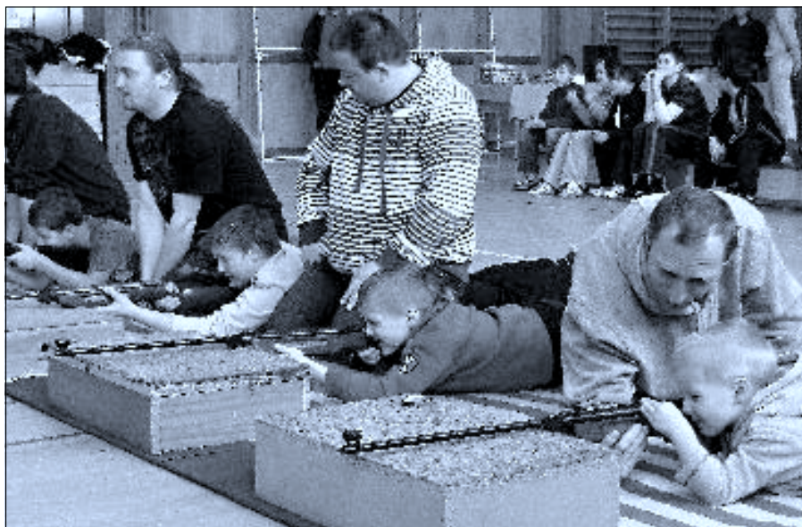
V sobotu 19. března se uskutečnil již XII. ročník obnovené střelecké soutěže O putovní pohár Ledenic. (více uvnitř čísla)