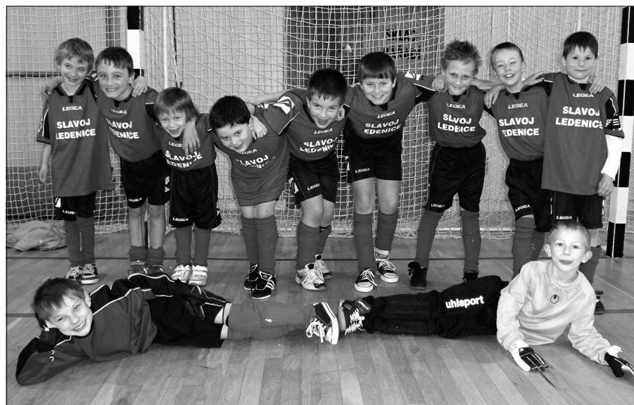
Mladší příprava Slavoj Ledenice – halový turnaj H. Stropnice 20. 3. 2011