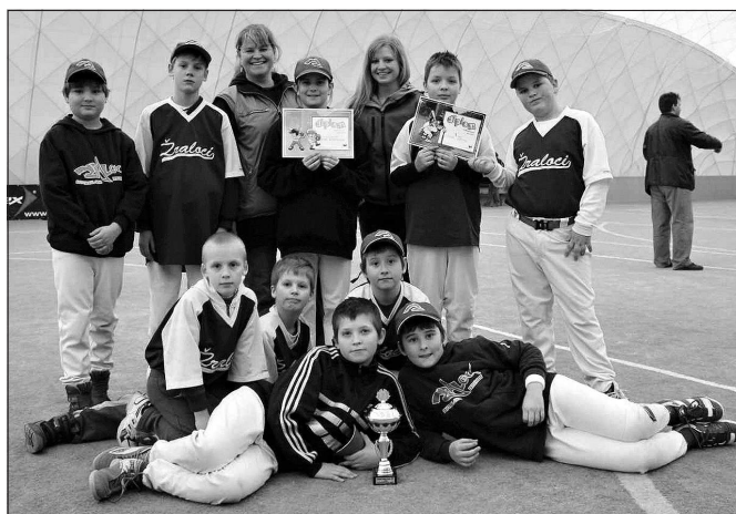
Teebal halový turnaj 19. 2., Č. Budějovice