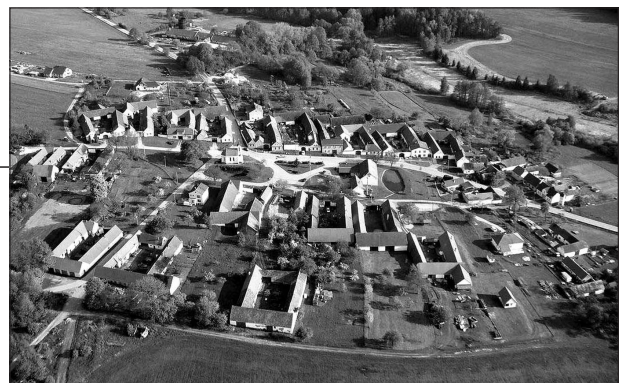
Letecký pohled na osadu Zaliny

Zoufalým pokusem o zvrácení situace bylo formování desetitisícové armády, kterou vytvořil z najatých žoldnérů pod záminkou vojenského zásahu na neklidné německo-nizozemské hranici. V jejím čele stanul Rudolfov mladší a cílevědomý bratranec Leopold, biskup v německém Pasově. Na počátku roku 1611 se ovšem vojáci, označovaní běžně jako Pasovští, vypravili náhle na Rudolfov příkaz (snad vniknutý odpůrci Majestátu) do Čech a přes České Budějovice dorazili do Prahy, kde Leopold očekával zisk trůnu a koruny po Rudolfovi. Nezásobovaná a neplacená armáda s vidinou velké kořisti vyplundrovala Malou Stranu a Hradčany, přičemž se proti ní rychle připravovalo vojsko českých šlechticů a voj-