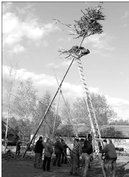
V sobotu 30. dubna proběhne u Horní Jámy další Tradiční ledenická májka. (více uvnitř čísla)