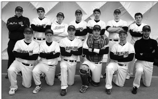
Muži - halový turnaj 12. 2. 2011 Č. Budějovice

e-mail: korcak@ddmcb.cz, tel. 386 447 313, mobil: 724 094 869