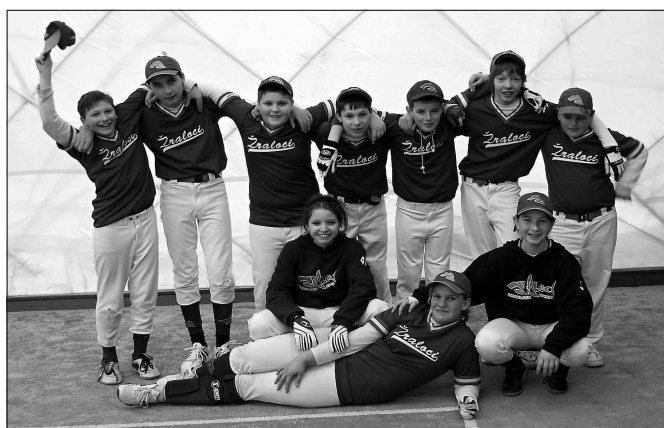
Žáci halový turnaj Most 20. 2. 2011