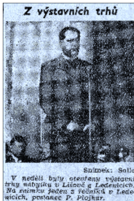
Snímek Josefa Plojgara při návštěvě Ledenic 10. 8. 1947 otištěný v deníku Práce

Zcela odlišné postavení oproti všem předchozím osobám zaujímá Vojtěch Filip (1955), předseda KSČM a dlouholetý místopředseda Poslanecké sněmovny, který má z Ledenic manželku, vlastní zde chalupu a tráví u nás svůj volný čas.