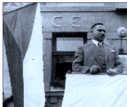
Ministr vnitra Juraj Slávik při projevu před ledenickou radnicí 5. 7. 1931