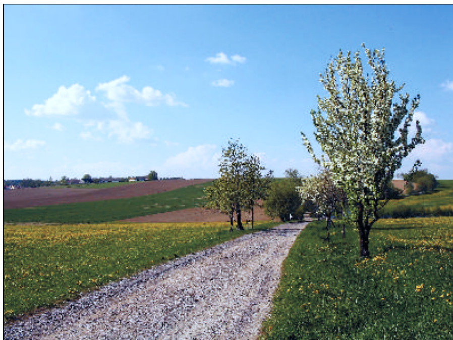
Cesta mezi Mysletínem a Ohrazeníčkem