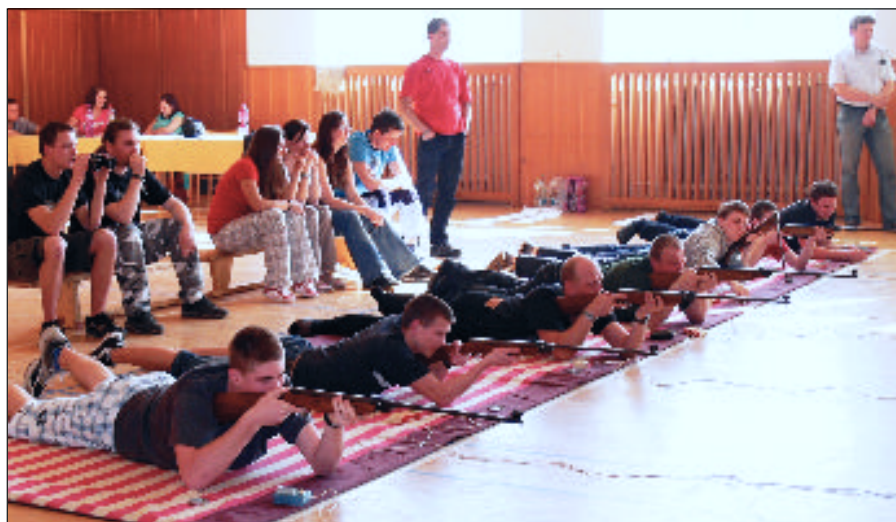
Vrcholné soustředění. Závodníci v kategorii muži 15-45 let

Kategorie C, D, E, F, a G střílí vleže na vzdálenost 10 m bez opory 15 ran na 3 terče o velikosti 8 x 5,5 cm.