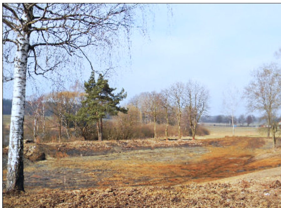
V Zálince byl po třiceti letech odbahněn Nový rybník (pod Mohňů). Práce byly plně hrazeny z rozpočtu městyse Ledenice.