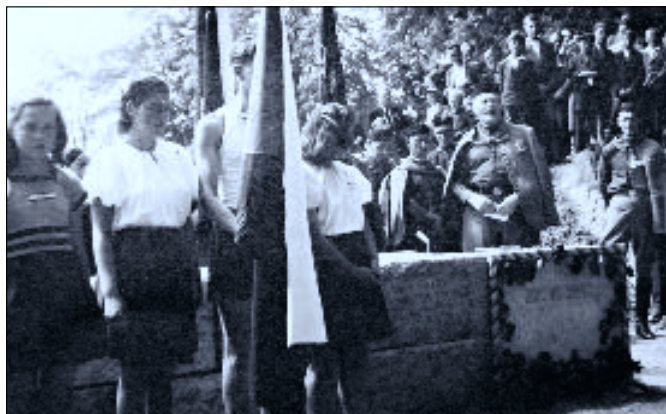
Slavnostní položení základního kamene nové sokolovny 22. 6. 1947