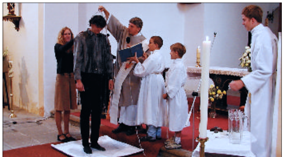
Křest dospělého, na který se o letošní vigilií opět těšíme (ilustrační foto)