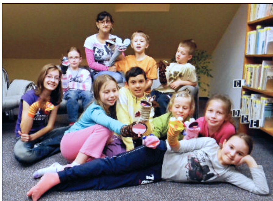
V pátek 30. 3. se ledenická knihovna již potřetí zapojila do projektu Noc s Andersenem. Podrobnosti v příštím čísle Ledenického zpravodaje.