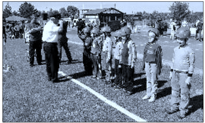
Dvojboj Ledenice – hlášení před požárním útokem

Nedělního dne 13. 5. přijelo 65 soutěžících ve 4 kategoriích. Starší žáci a žákyně, mladší žáci a žákyně. Počasí nám přálo, přestože být o nějaký ten stupínek na teploměru víc, nikdo by se nezlobil. Po slavnostním zahájení se začalo kategorií mladších žákyň, následovali mladší žáci, obě kategorie ve věku 6-11 let. A jste-li takový závodník, musíte