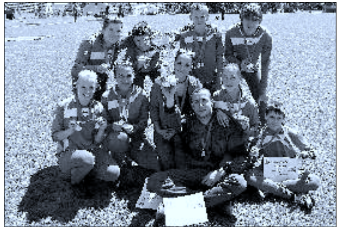
Dvojboj Ledenice – starší žáci 1. místo

na trati v celkové délce 60 metrů nejprve překonat 80 cm vysokou bariéru a to nejlépe skokem, ten plavmo je ovšem zakázán ☺, za běhu seberte ze země dvě hadice a už je tady další překážka v podobě 4 metry dlouhé a 80 cm vysoké kladiny, chvilka času pro zapojení středů hadic k sobě a už se shýbáte k rozdělovači, kde zapojujete jednu ze spojek, teď ještě zpoza pásku vytáhnete proudnici a napojíte na zbývající spojku, kterou ještě máte v ruce. Právě se vám podařilo pospojovat hadicové útočné vedení a hurá, ještě pár mihnutí nohou a jste v cíli. Povedlo se vám to ve vaší kategorii nejrychleji? Pak je zlatá medaile právem vaše. Tady nejde jen o to, držet se v jistém smyslu přísloví: „Kdo uteče, vyhraje,“ ale i šikovnost rukou a načasování.