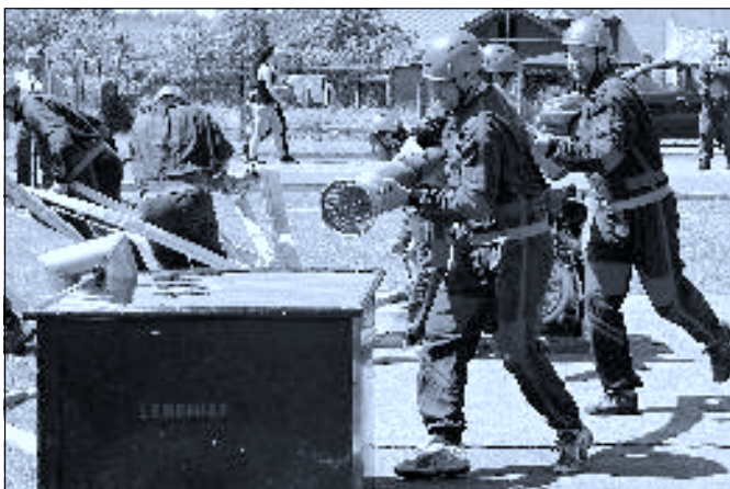
Memoriál F. Janáčka – naši borci v akci