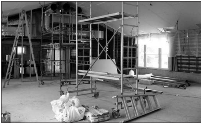
Mateřská škola – sádkartonářské, topenářské a elektroinstalační práce