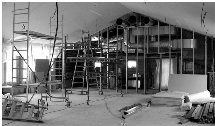
Mateřská škola v Ledenicích – přístavba pokračuje i v zimních měsících