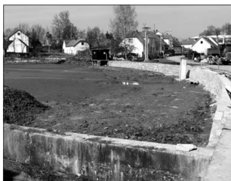
oprava hráze rybníka Parčák