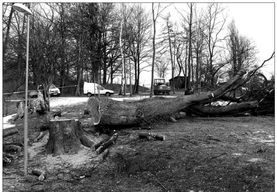
V lednovém vydání Ledenického zpravodaje jsme informovali o nutnosti porazit vzrostlý dub u budovy školní družiny (svisle prasklý kmen). Z důvodu nepříznivého počasí však bylo možné strom porazit až začátkem března.