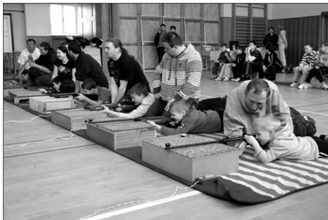
Nejmenší střelci a ženy mají v Ledenicích povoleného korektora