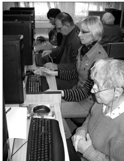
V Ledenicích budou od září probíhat odpolední kurzy pro dospělé foto internet

Evropský zemědělský fond pro rozvoj venkova: Evropa investuje do venkovských oblastí.