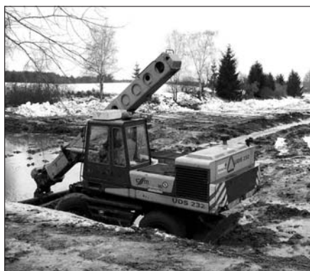
Koncem února bylo zahájeno odbahnění rybníka Punčocha v k.ú. Zaliny.