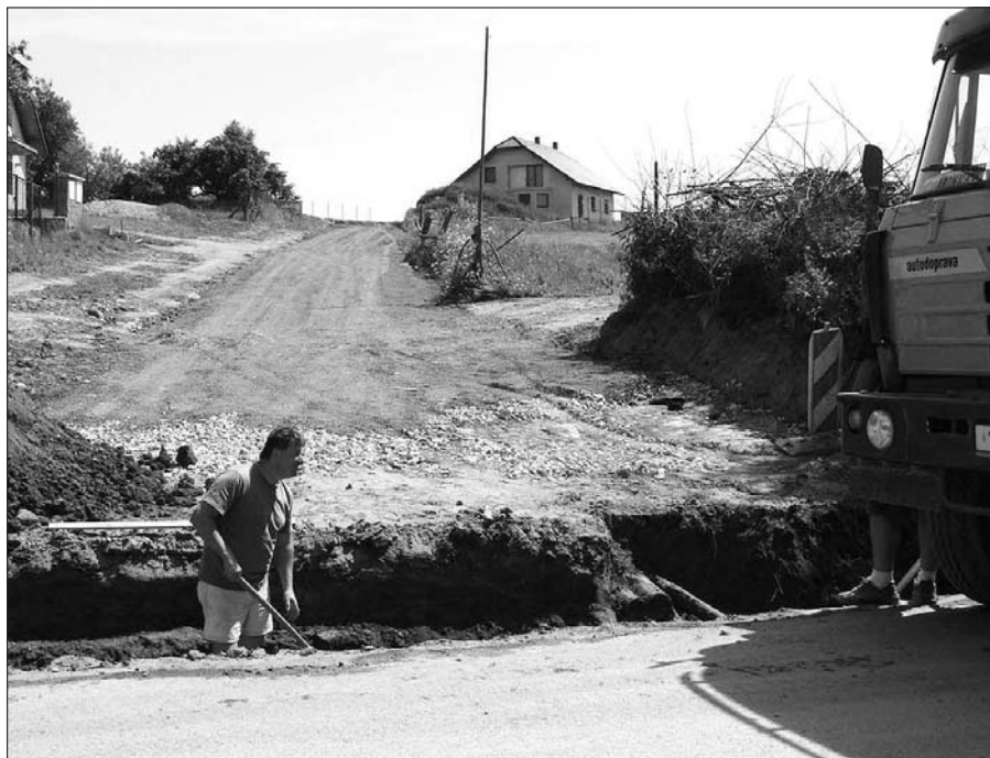
V měsíci květnu byla v Zalinech dokončena výstavba nového kanalizačního řadu a příjezdové komunikace k nové zástavbě rodinných domků.