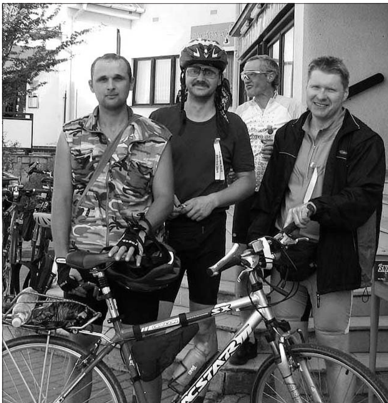
Účastníci Jízdy pro Růži při zastávce v Ledenicích.