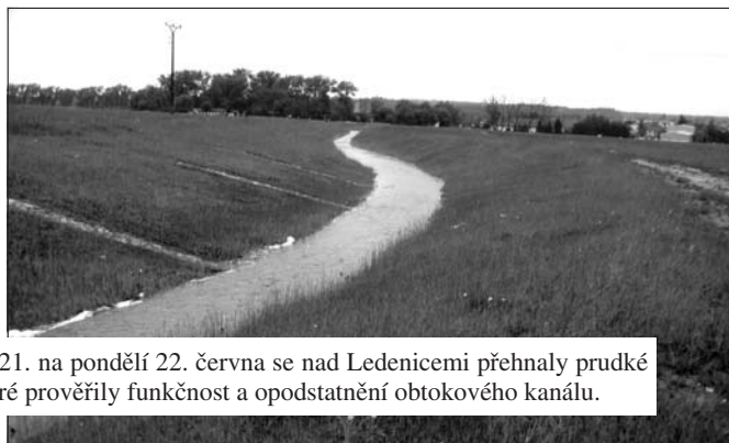
Z neděle 21. na pondělí 22. června se nad Ledenicemi přehnaly prudké deště, které prověřily funkčnost a opodstatnění obtokového kanálu.

Málokdy se něco pochválí, ale já mám tentokrát pocit, že je to více než nutné.