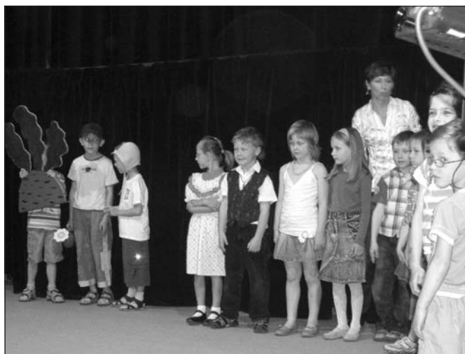
Vystoupení dětí z I. oddělení MŠ

1. června na Den dětí předškoláci absolvovali náročný výlet do planetária v Č. Budějovicích. Zde zhlédli pohádku o Rákosníčkově a seznámili se s hvězdnou