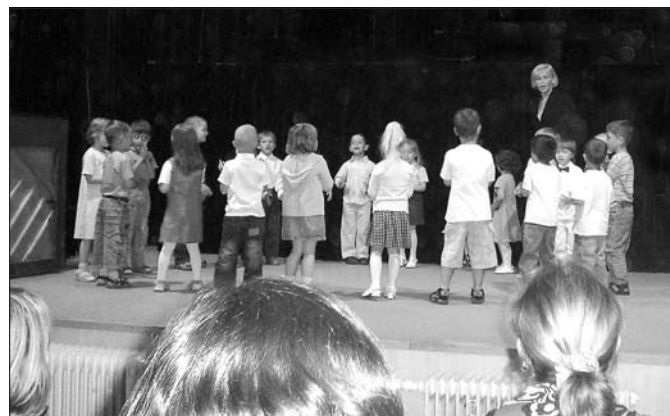
Vystoupení dětí z II. oddělení MŠ

oblohou. Mladší děti z prvního oddělení slavily Den dětí společně se základní školou 2. června. S 1. třídou si vyjely do nedalekého Dvorce. Tady si pozorně prohlédly všechna vystavená zvířata, některá si mohly i pohladit. V borovanské kavárně Zámek jsme si pochutnali na výtečné zmrzlině. Následující den děti mohly v divadelním sále obdivovat trochu starší