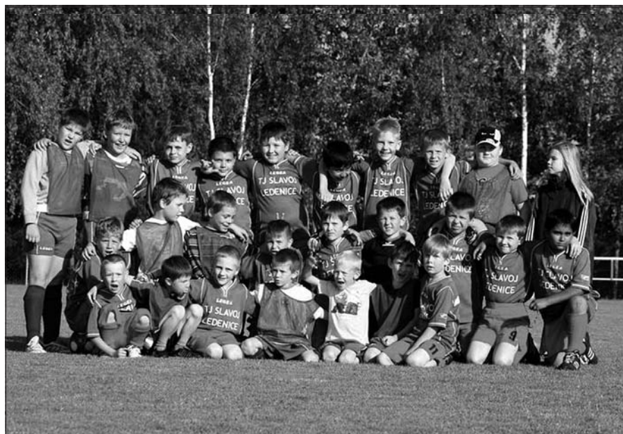
Starší a mladší fotbalová příprava Slavoj Ledenice

2:15 hod. ráno – hráč: „Já nemůžu usnout!“ Trenér: „Zalez!“ (pozn: Náměsíčník vše přestál v pořádku!)