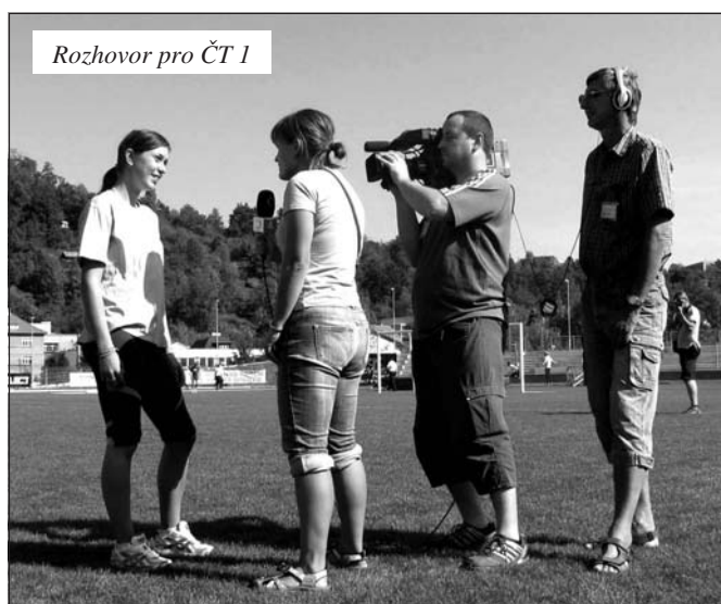
Rozhovor pro ČT 1