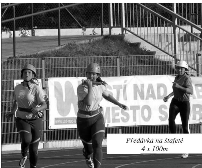
Předávka na štafetě 4 x 100m