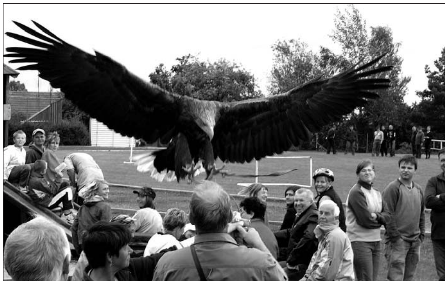
Z programu Dne spolků s mysliveckou tematikou, který proběhl 5. září 2009