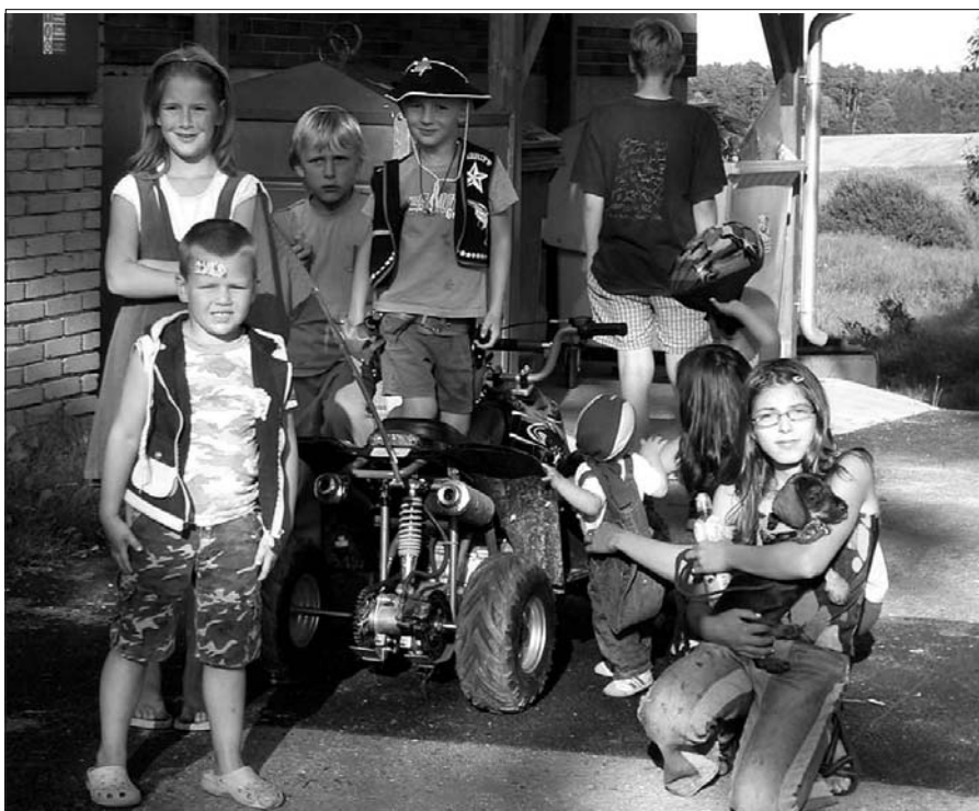
Poslední prázdninovou neděli se ohrazenké děti loučily s létem