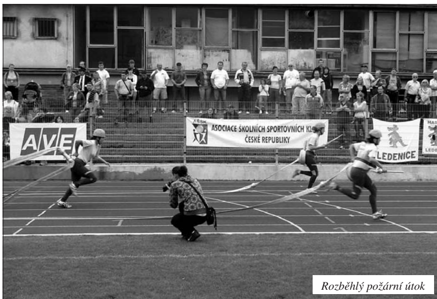
Rozběhlý požární útok

Náročný úkol čekal holky o víkendu od 18.9. do 20.9. v Ústí nad Labem. Předcházelo tomu ustavičné čtrnáctidenní cvičení, pak shánění dopravy a nakonec i všech potřebných věcí a materiálu. Vyjžděli jsme v pátek v půl šesté ráno, tedy chtěli jsme, než se to všechno ale dalo dohromady, tak bylo skoro šest. Stejně ale jsme přijeli do Ústí něco malinko po desáté a tak zbylo dostatek místa pro prezenci, ubytování a přípravu na nařízený trénink požárního útoku. Celá naše banda čítala patnáct lidí (deset závodnic, jeden vedoucí a řidič - podle oficiálního protokolu a pak „diváci“). Byla to fajn skupinka, taková bezproblémová a fungující, což znamená, že všichni zabrali,