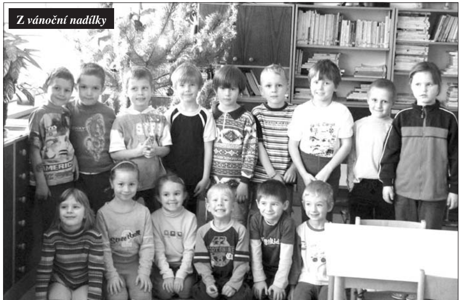
Z vánoční nadílky

Děkujeme též za projevenou soustrast a květinové dary. rodina