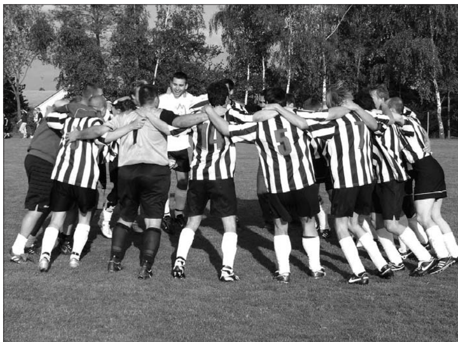
Radost z vítězství