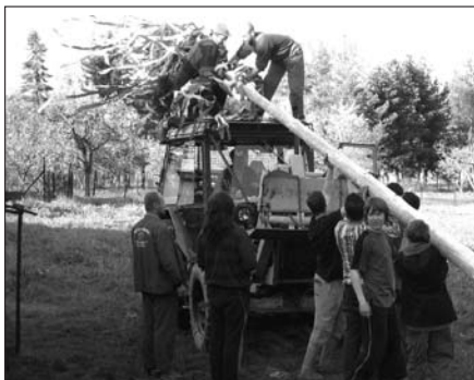
Stavění májky v Ohrazení

V sobotu 26. dubna uspořádal osadní výbor v Ohrazení soutěžní odpoledne s názvem Vítání jara. Soutěžilo se ve cvrnkání kuliček do důlku a v pétanque. Po náročných turnajích dětí i dospělých si všichni zasloužili občerstvení přímo z grilu, u kterého naplánovali průběh další akce. Ta se odehrála 30. dubna bylo jí tradiční stavění májky.