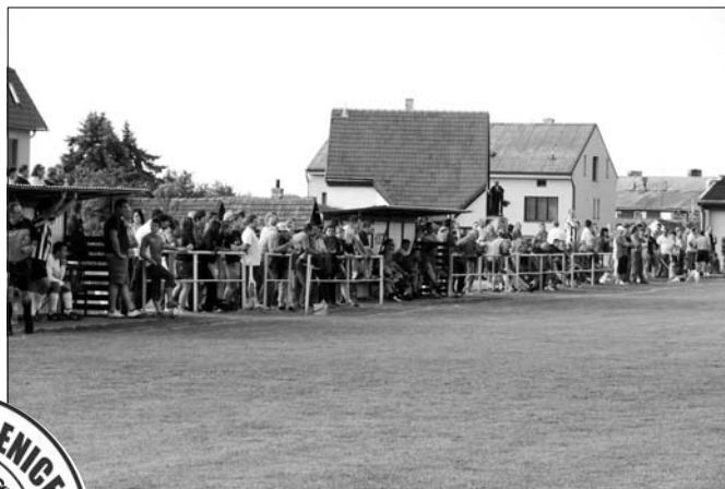
Fanouškové dodali utkání skvělou atmosféru