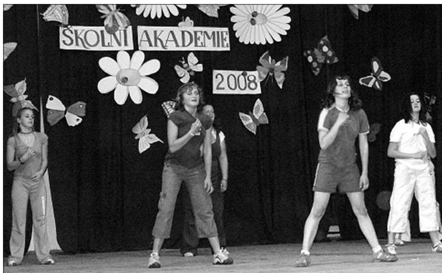
Taneční vystoupení dívek VIII. třídy

volná, a tudíž se jí nemuseli nutně všichni účastnit jako účinkující. O to více dozajista naše malé hudebníky, herce, tanečnice, sportovce a recitátory potěšil potlesk, kterým je spokojené publikum oceňovalo. Poněkud nás i za naše malé svěřence zamrzela „ohleduplnost“ některých diváků odcházejících daleko před koncem, protože vystoupení jejich ratolesti už skončilo a to ostatní je přece nezajímá.