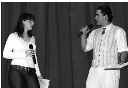
Ve dvou se to lépe táhne – naši moderátoři

Školní akademie 2008 byla od samého počátku chápána jako akce pro žáky ZŠ dobro-