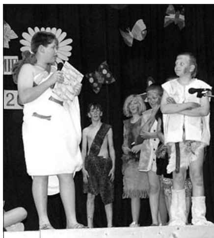
Pravěká škola v podání pátáků

volná, a tudíž se jí nemuseli nutně všichni účastnit jako účinkující. O to více dozajista naše malé hudebníky, herce, tanečnice, sportovce a recitátory potěšil potlesk, kterým je spokojené publikum oceňovalo. Poněkud nás i za naše malé svěřence zamrzela „ohleduplnost“ některých diváků odcházejících daleko před koncem, protože vystoupení jejich ratolesti už skončilo a to ostatní je přece nezajímá.