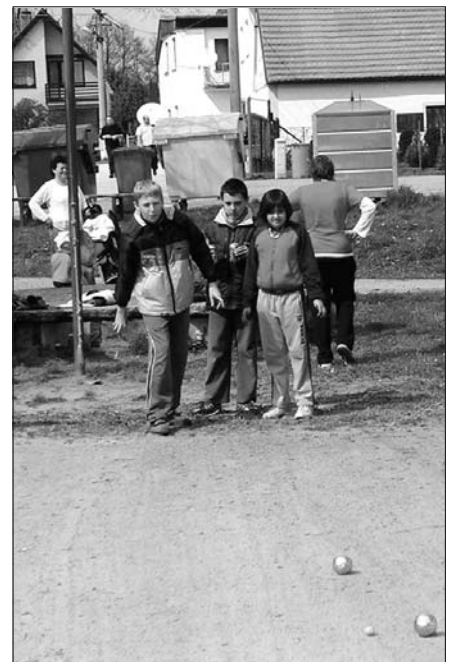
Turnaj v pétanque