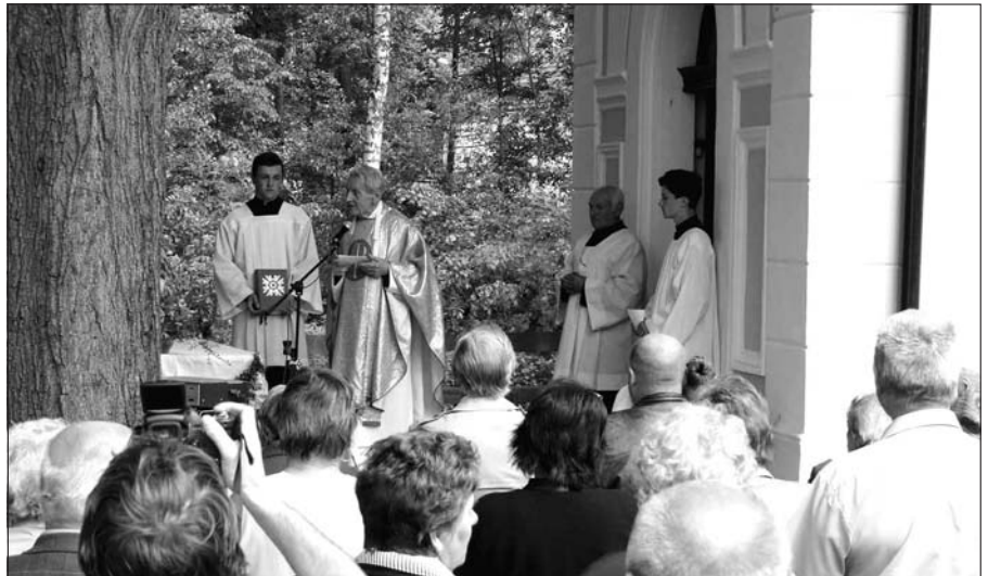
Součástí oslav byla i Mše sv.