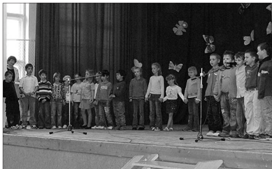
Nejmenší recitátoři – I. třída

Co dodat závěrem? Podle ohlasů těch, kdo byli na jevišti, i těch, kdo z hlediště aplaudovali, se letošní akademie vydařila. Drobné chybičky, nechť laskavý divák promine a podnětné připomínky v naší škole rádi uvítáme.