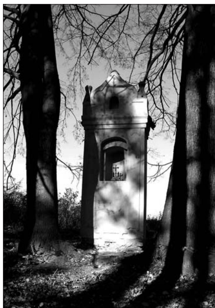
Kaplička na Sv. Voršile září po letech chátrání novotou

Historie místa začíná v osmdesátých letech 17. století objevením pramene vody, kterému