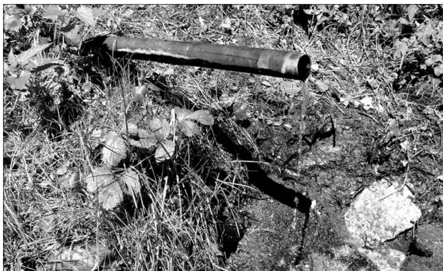
Dodnes vyvěrající pramen údajně léčivé vody

Lázně zde fungovaly ještě pár let, v roce 1723 sem byl instalován nový kotel. Avšak jejich zánik se neodvratně blížil, především kvůli prosperitě blízkých lázní na Dobré Vodě a v Libniči, které si nový pán velmi oblíbil.