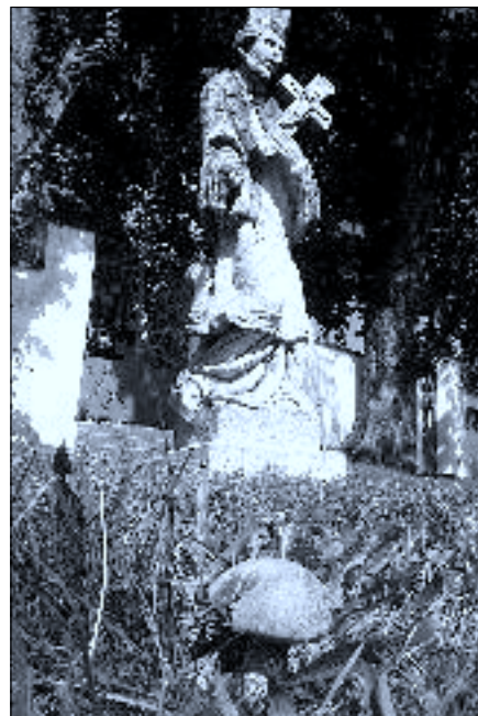
Po několika letech opět na ledenickém náměstí vyrostl hřib kovář

22. 9. požár slámy v zemědělském objektu Ledenice, nutné použití dýchačů a vysokotlakého zařízení na obou vozidlech.