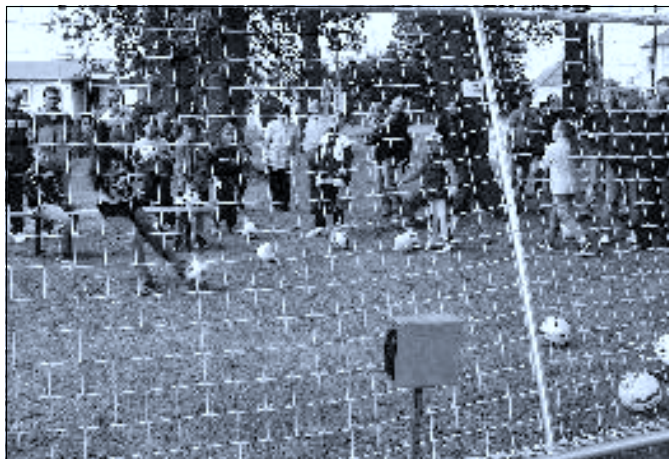
Na změření rychlosti střely radarem se stály fronty