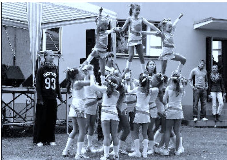
Vystoupení Sharks Cheerleaders