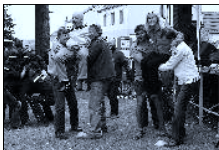
Disciplína Přenos raněného – Rybáři a Škola na startu