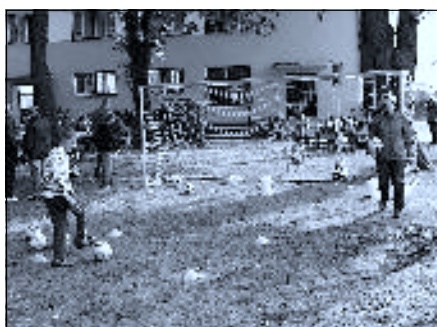
Jednou ze soutěží pro děti byla střelba na přesnost