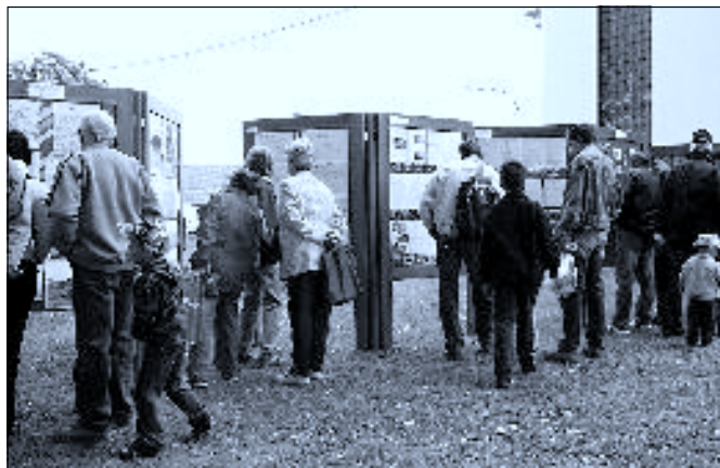
Výstava fotografií a zápisů ze „slavojáckých“ kronik – Věděli jste, že TJ Slavoj byla založena už v roce 1933?!