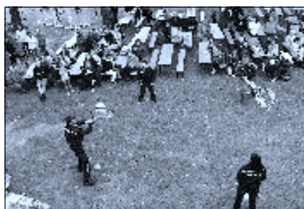
Disciplína Maxi-Tenis – takhle hrají Hasiči