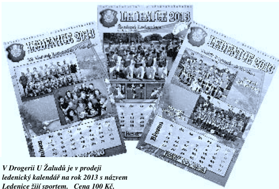
V Drogerii U Žaludů je v prodeji ledenický kalendář na rok 2013 s názvem Ledenice žije sportem. Cena 100 Kč.