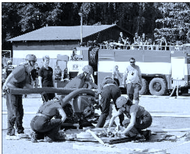
Okres ČB – ilustrační foto