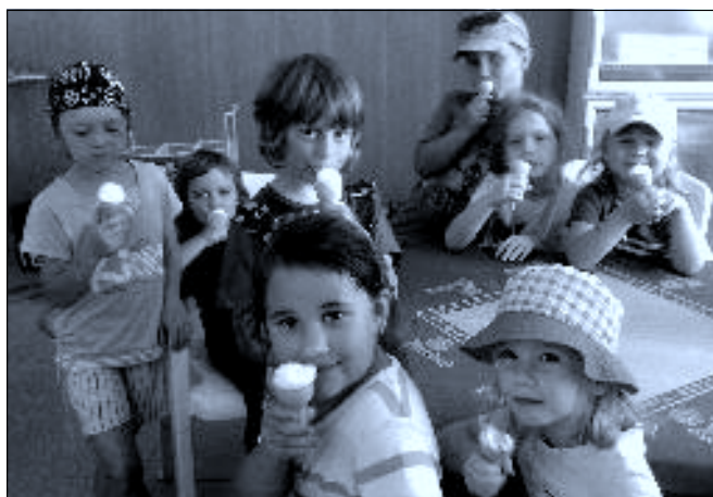
Na zmrzlině v cukrárně