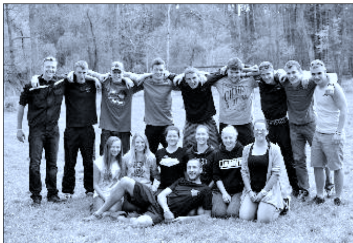
Ahoj – a vždy s úsměvem