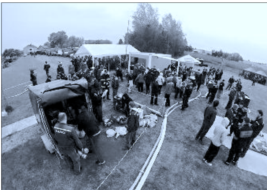
Obvod Radostice

Zde nás reprezentovalo družstvo žen. I hasičina je náročný sport na čas, vše a všechny okolo. Odpusťte mi tu malou soukromou tírádu, ale tentokrát nám s malým prckem manžel-