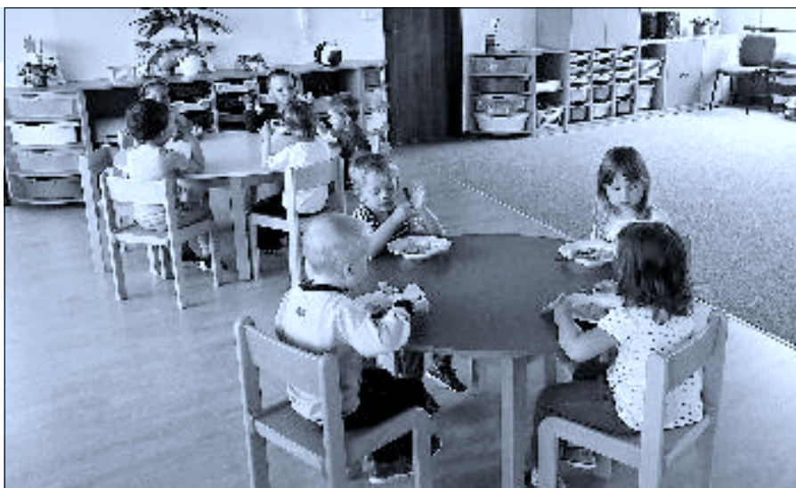
Děti ve Sluníčkové třídě

A konečně je tu červen, poslední měsíc školního roku. První den v měsíci vyrazíme „za pokladem“. Hledající plní úkoly, týkající se různých oblastí a témat z průběhu celého roku. Na konci cesty nalézají poklad – své kamarády, drobné dárky a sladkosti. Na výlet jedou všechny děti do Týna nad Vltavou. Na otáčivém hledišti můžeme sledovat osudy líného chlapce Vojtíška, který se samozřejmě polepšil, a v místním muzeu si prohlédneme vltavíny, dřívě používané předměty, oblečení, zbraně, ale i loutky nebo panenky. Navíc si děti mohou spoustu věcí vyzkoušet a osahat. V horkém počasí