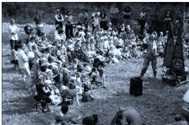
Dětský den ↑