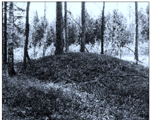
Jedna ze šestnácti dochovaných slovanských mohyl na Vápenic- kém kopci. Průměr mohyly je cca 8,5 m, její výška 90 cm