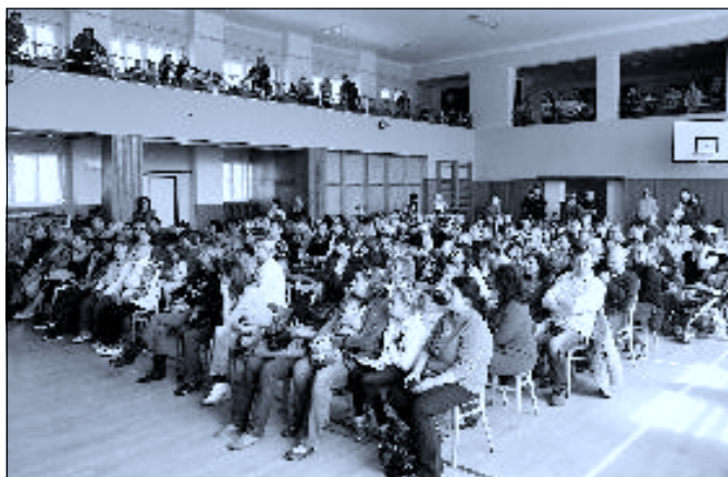
Koncert ke Dni matek ↑