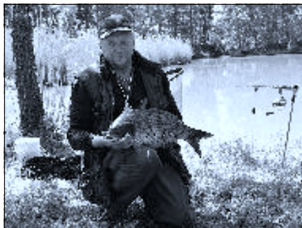
Největší úlovek – kapr 65 cm