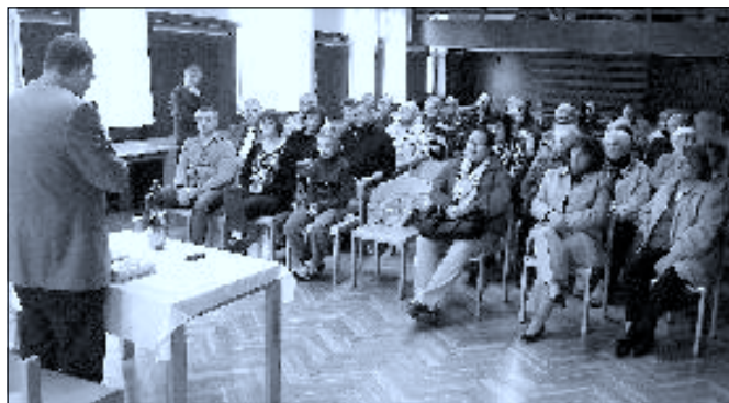
Přednáška k výročí upálení mistra Jana Husa