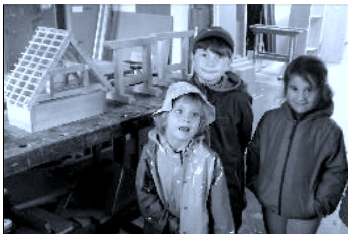
Na návštěvě u truhlářů