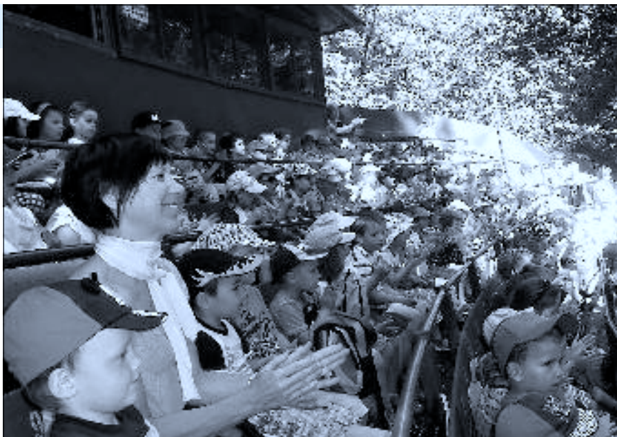
Výlet na pohádku do Týna nad Vltavou

V měsíci březnu všechny třídy navštívily knihovnu. Je vidět, že některé děti jsou s knihami dobře obeznámeny, pravidelně je jim čteno, nebo se vypráví. Má to dobrý vliv na správnou výslovnost dětí, slovní zásobu i gramatickou správnost při vyjadřování. Ale co stojí za zmínku je hlavně to, že děti, které ni-