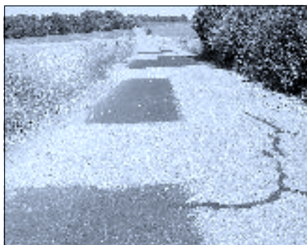
Opravená cesta od Zalin k Ortvínovicím