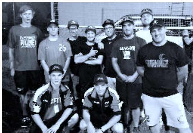
Žraloci hrají největší Evropský turnaj Supercup 2015 za různé evropské týmy