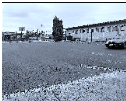
Sokolská ulice a parkoviště u hřiště