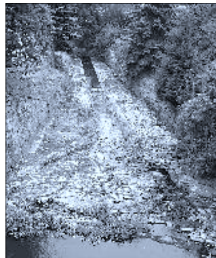
Po dohodě s firmou Povodí Vltavy byla vyčištěna část Spolského potoka od splavu rybníka Lazna k novému mostu