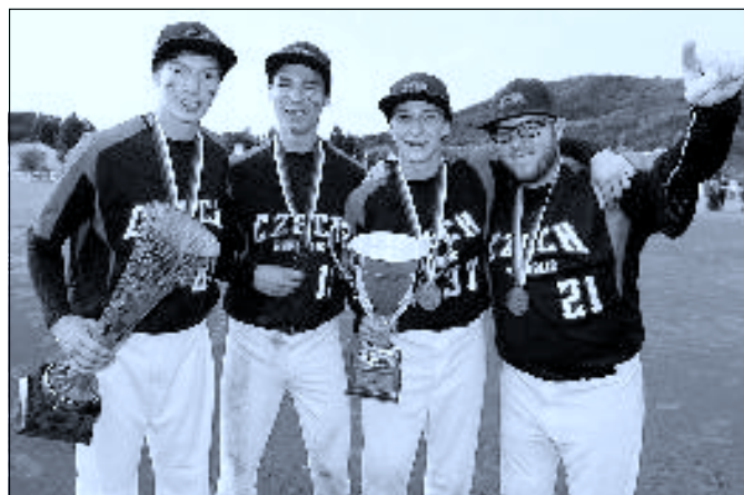
Zlatí junioři na ME