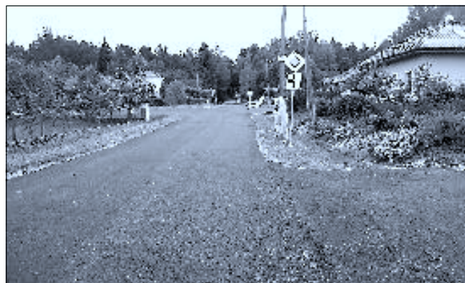
Ulice 5. května