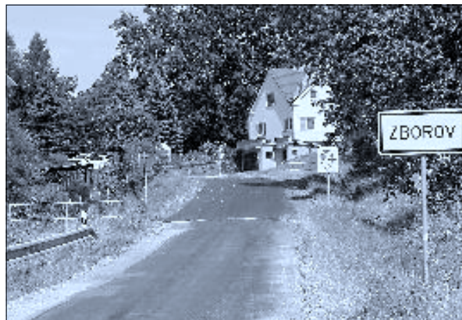
Opravená komunikace ve Zborově