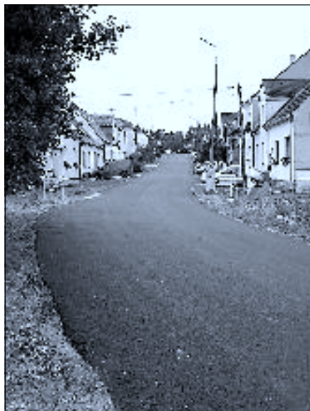
Ulice 5. května