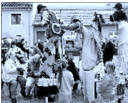
Chůdaraři z divadla Studna dokázali pobavit nejen děti, ale i dospělé