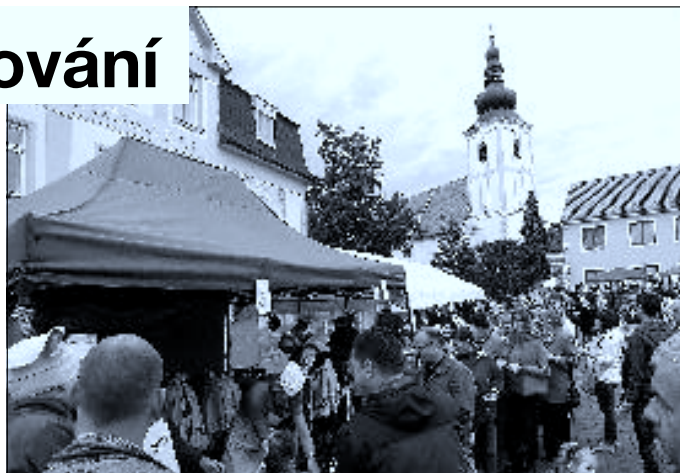
Fronta na čmundu