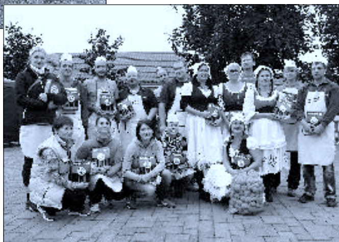
Sedmnáct odvážných, kteří se dobrovolně přihlásili a celé odpoledne pekli a pekli. I vám díky.