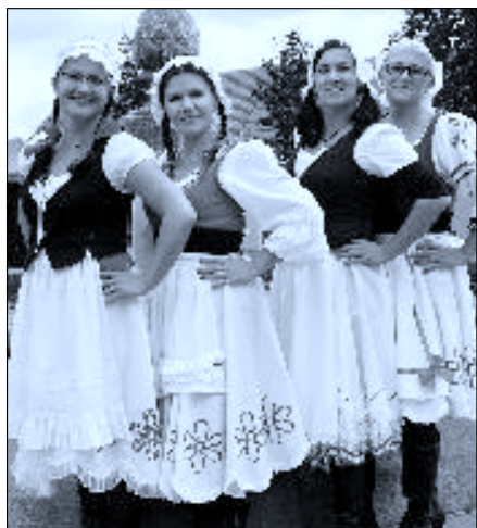
A největší překvapení? Tím byl bezesporu přespolní tým Zbrambůrky, který dorazil v úžasných krojích selek.

Poděkování patří všem zúčastněným, pořadatelům, soutěžním týmům, prodejům občerstvení, vedení školy. Lednickým rybářům, hasičům a lodním modelářům díky za zapůjčení párty stanů. jk