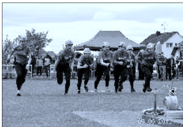
Memoriál – ženy I

Ledeničtí hasiči přejí Vám všem krásnou vánoční pohodu a do nového roku nezlomné zdraví, optimismus a štěstí.