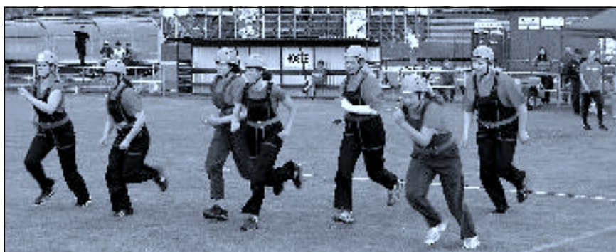
Memoriál – ženy II