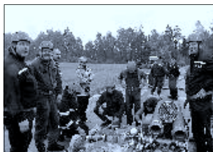
Obvod Jílovice – také nadpětáctičtíci