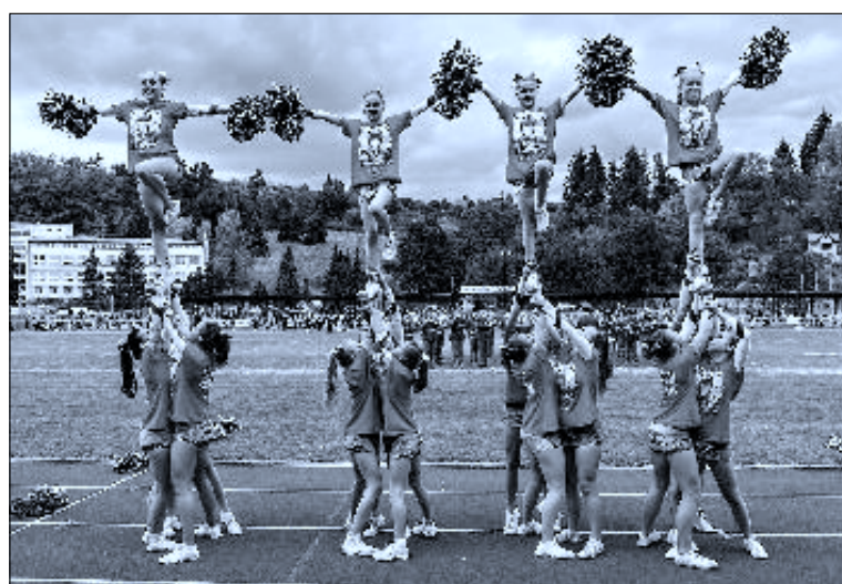
Vystoupení v Českém Krumlově