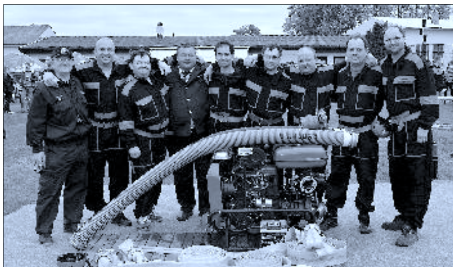
Memoriál – nadpětáctičtíci