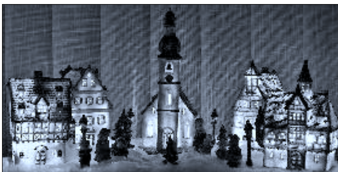
Vánoční výzdoba domu č. p. 145 na náměstí

Rezervace na tel. č. 606 767 753, 724 336 326.