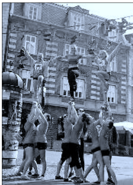
Tak jsme se bavili v Lublani