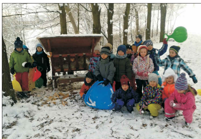
Pejsci u krmelce