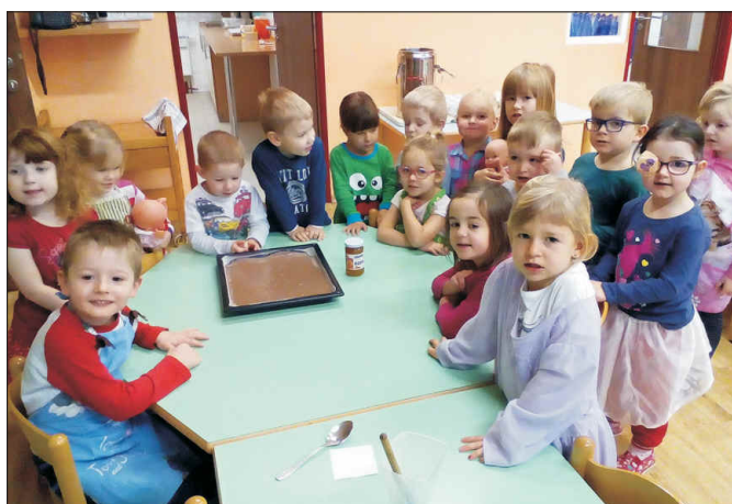
Pečení perníku u Ježků