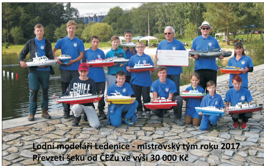
Lodní modeláři Ledenice - mistrovský tým roku 2017 Převzeti šeku od ČEZU ve výši 30 000 Kč