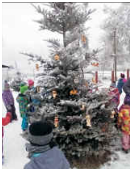
Zdobení stromečku na zahradě

za kolektiv dětí a učitelek MŠ Vlasta Plchová