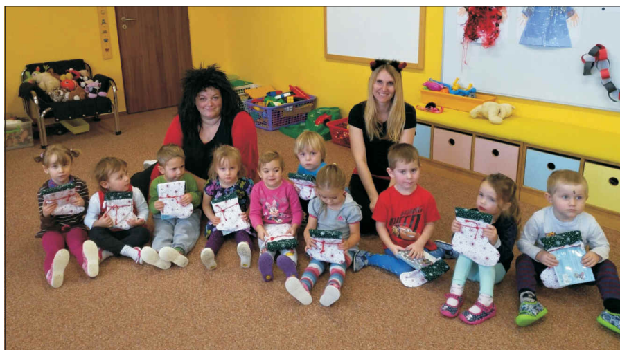
Mikuláš u Kotat

Poslední týden před vánočními prázdninami jsme společně ozdobili stromeček na zahradě a zazpívali si vánoční koledy. Poté k nám do