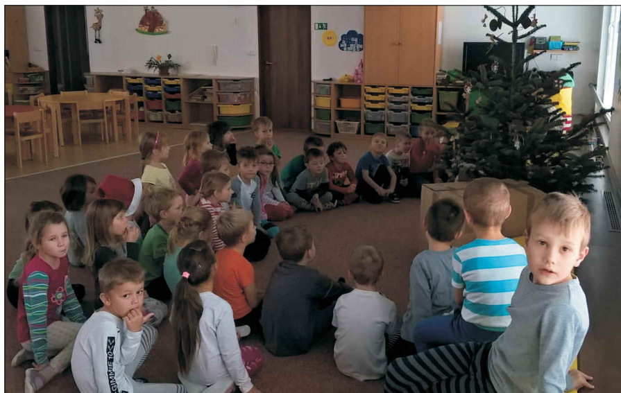
Nadílka u Sluníček