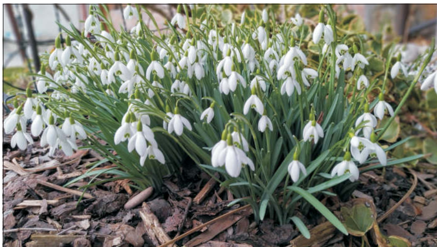
Téměř po celý únor zdobily rozkvetlé trsy sněženek zahrady a parky