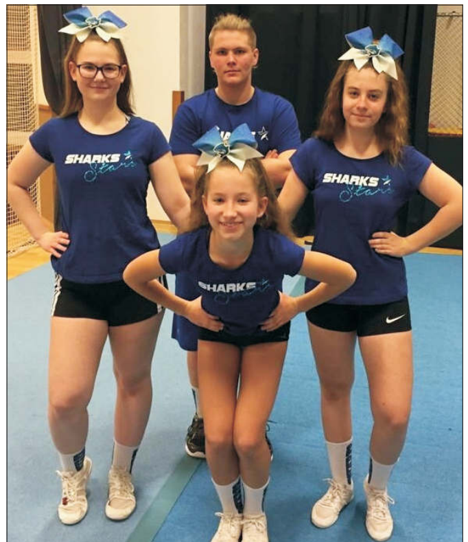
Group Stunt junior Elite Coed, 2. místo – Sharks Warriors