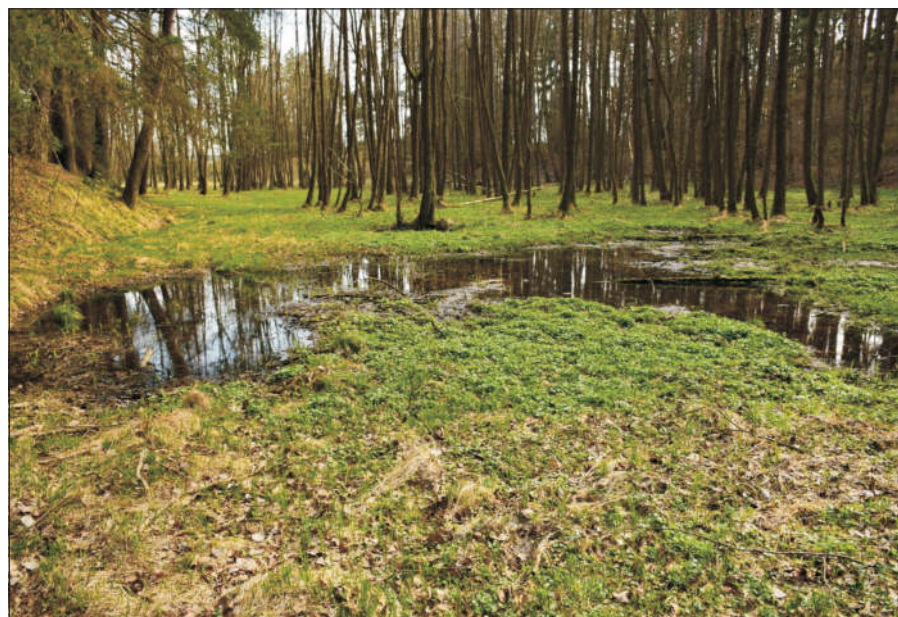
Dočasné tůňky se v místě dodnes objevují, ale jen na jaře nebo po vydatnějších deštích