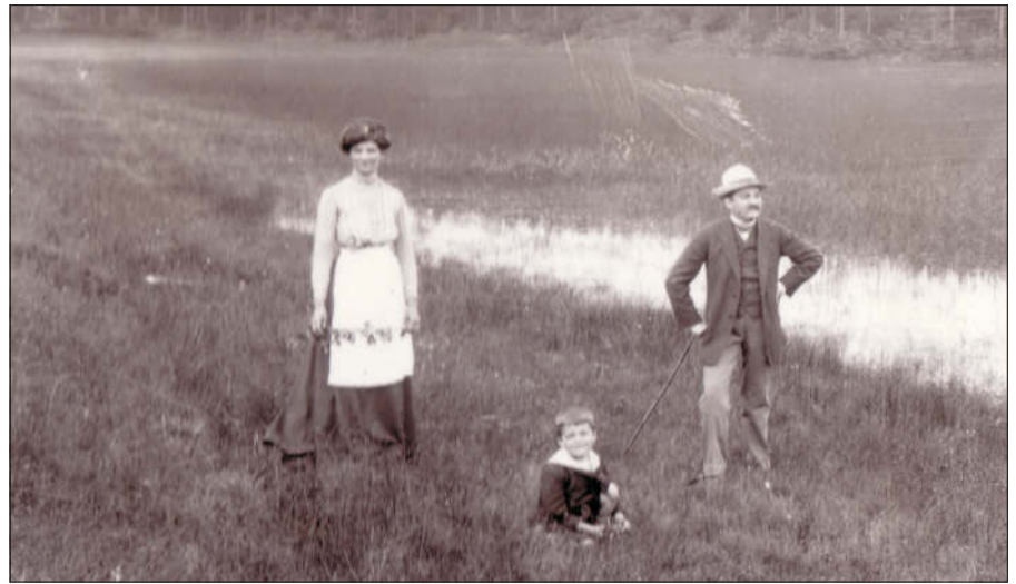
Lokalita Kouty byla na počátku 20. století oblíbeným cílem vycházek našich předků. Na snímku je vidět jedna z tůní