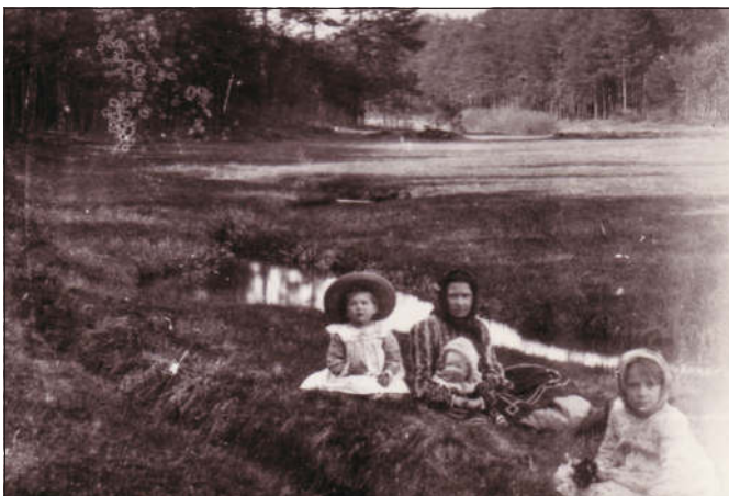
Odpočinek výletníků na břehu meandrujícího potoka v Koutech před sto lety