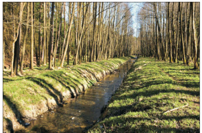
Regulovaný Spolský potok a lesní porost v místech luk v Koutech v současnosti