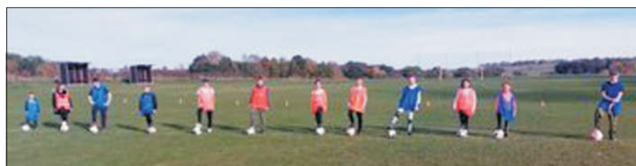
Dětský fotbalový kroužek