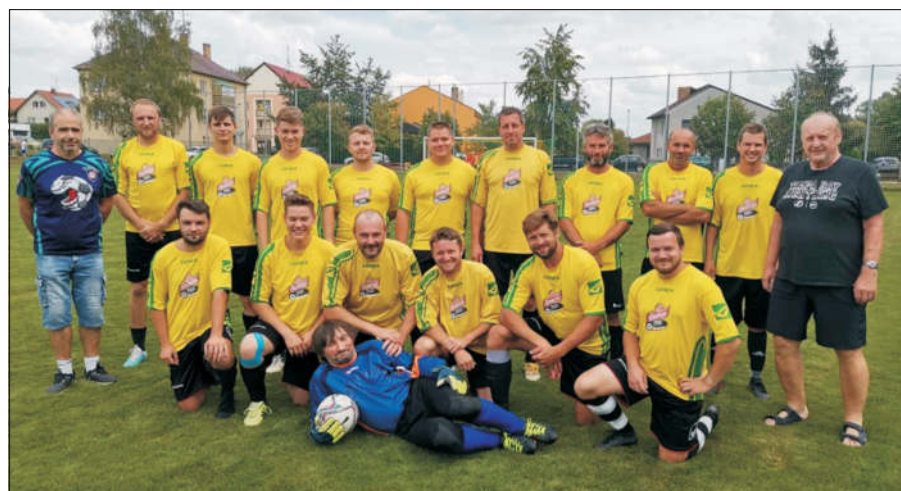
Tým zborovských fotbalistů