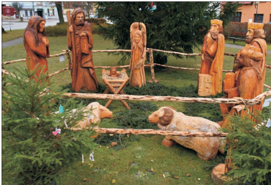
V adventním čase si můžete na náměstí prohlédnout vyřezávaný betlém, do kterého letos přibyly postavy tří králů a anděla